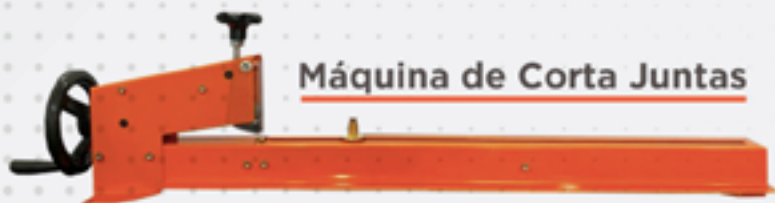
Máquina de Corta Juntas