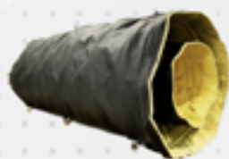
Trombas de Descarregamento