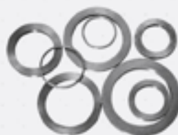
Protetor de Flange