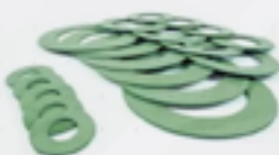
Juntas de Vedação