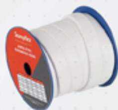
Fita de PTFE