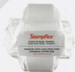
Protetor de Flange